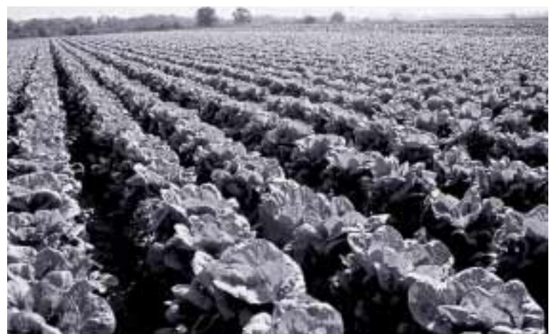
Objetivo: conseguir que la huerta sea un espacio de equilibrio, integración y fuente de recursos para una alimentación sana y natural