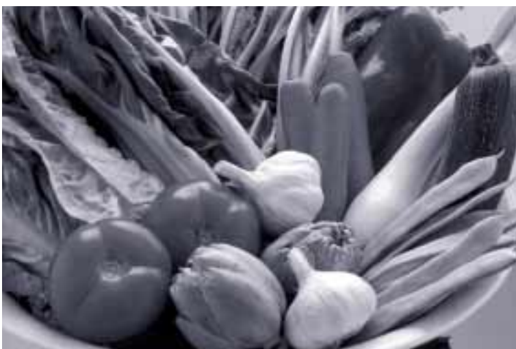
Los consumidores aprecian la calidad de los productos hortofrutícolas zaragozanos