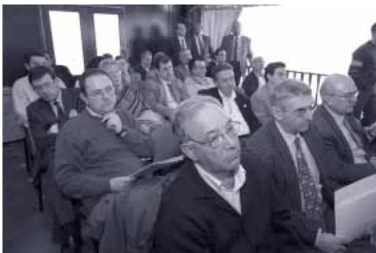
Un centenar de personas asistieron a la presentación de la huerta en Mercazaragoza

Por su parte, Arguilé corroboró el respaldo del Gobierno de Aragón para aprovechar el potencial de la huerta. “No hay que olvidar que en la comarca de Zaragoza hay instaladas 47 empresas agroalimentarias, más de 12 cooperativas, hay pueblos que aún tienen mucha actividad agraria y, por lo tanto, es una comarca importantísima desde el punto de vista de la economía agraria”, explicó.