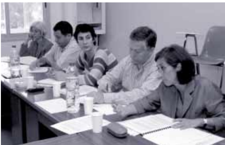
La CIEP 3 conoció el informe sobre la vivienda elaborado por El Justicia de Aragón

Recientemente, el pasado seis de mayo, se constituyó una Mesa de trabajo sobre las nuevas tecnologías y la sociedad del conocimiento , con el propósito de poner en marcha las siguientes acciones previstas en el Plan Estratégico: Impulsar la incorporación de las nuevas tecnologías a la sociedad en general y a los recursos humanos en particular y potenciar la Universidad como punto entre el conocimiento y