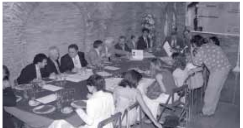
La sede del Justicia de Aragón acogió la presentación del Premio a los medios de comunicación

EBRÓPOLIS ha puesto en marcha una interesante iniciativa –novedosa en la capital aragonesa pero con una larga y positiva experiencia en todo el mundo- encaminada a premiar y promocionar las distintas conductas positivas existentes en la sociedad zaragozana. Como punto de encuentro de todas aquellas personas, colectivos y entidades interesadas en trabajar por un futuro mejor para Zaragoza y su entorno, la Asociación pretende con este concurso aportar y dar a conocer diferentes actuaciones que sirven de ejemplo en el esfuerzo común de mejorar la convivencia y la calidad de vida en la zona.