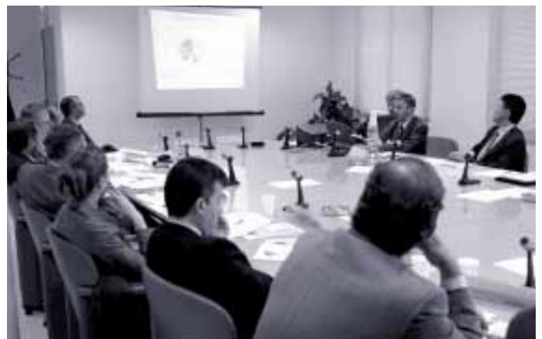
En mayo, se constituyó la Mesa sobre las tecnologías y la sociedad del conocimiento