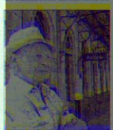
España, última esperanza.